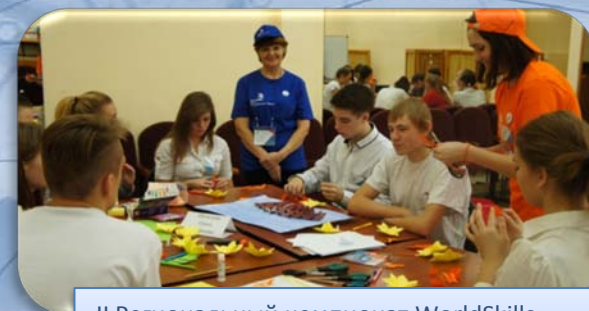
II Региональный чемпионат WorldSkills Russia - г. Кемерово