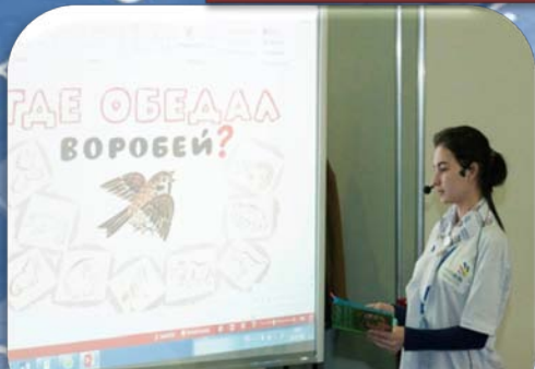
Полуфинал Национального чемпионата Сибирского федерального округа WorldSkills Russia - г. Красноярск