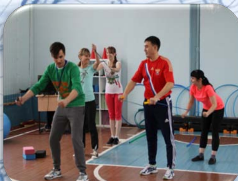
I Открытый чемпионат WorldSkills Russia - г. Тольятти