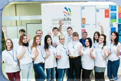
Финал IV Национального чемпионата WorldSkills Russia - Подмосковье