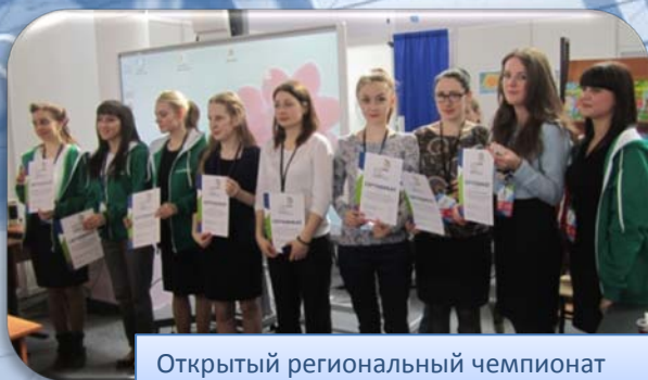
Открытый региональный чемпионат WorldSkills Russia - г. Казань