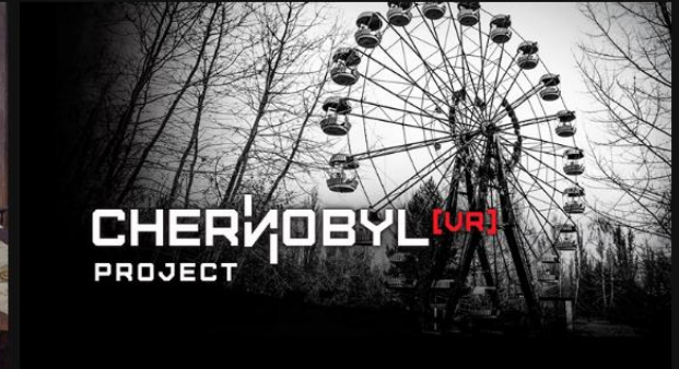
Chernobyl VR Project 4,99 $