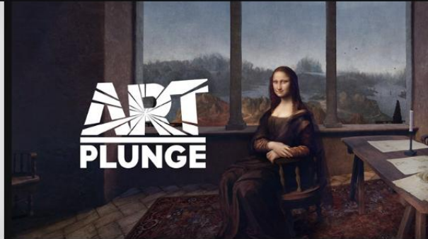
Art Plunge 1,99 $