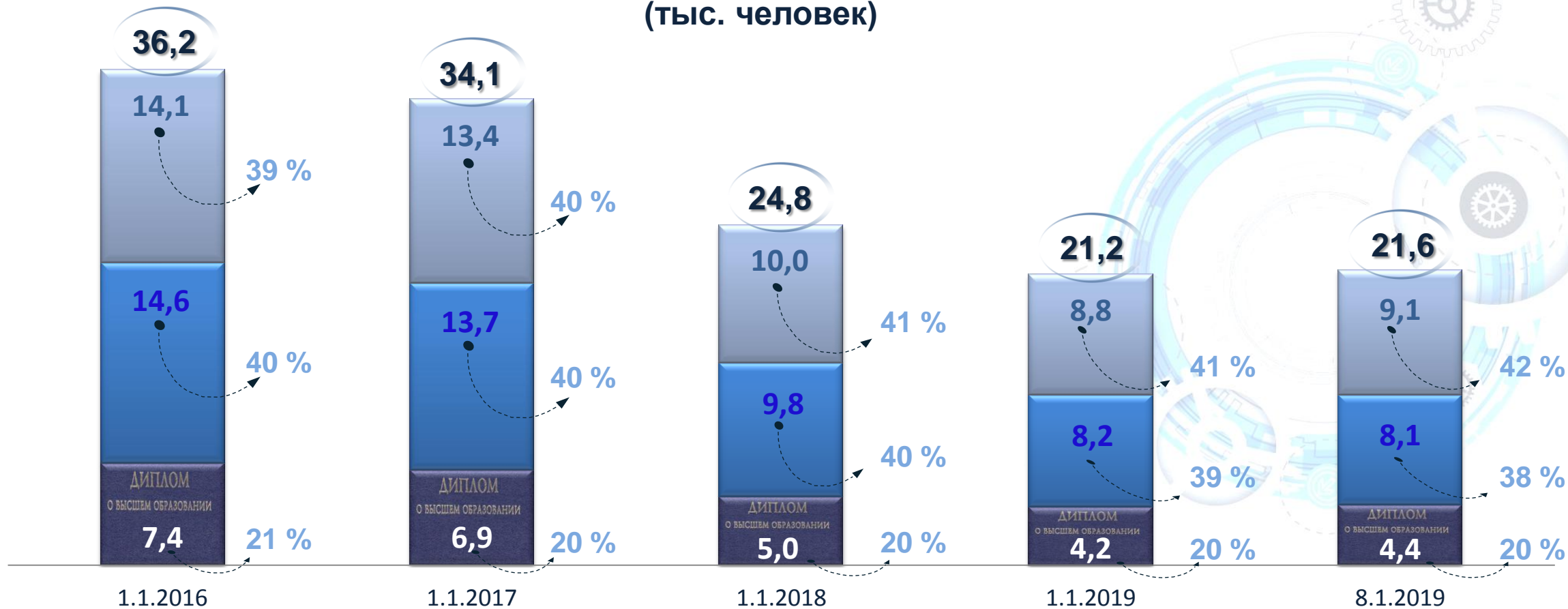
Состав численности безработных по уровню образования (тыс. человек)

■ Высшее образование ■ Среднее профессиональное образование ■ Нет профессионального образования