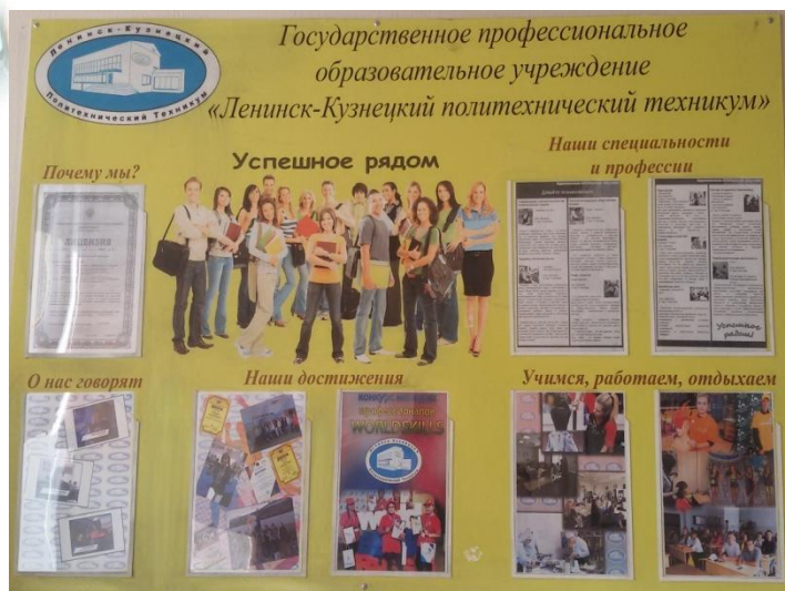
Стенды в школах города