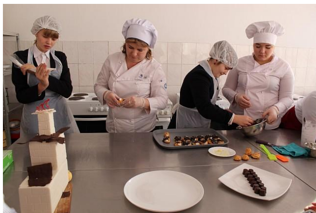
по профессии «Повар, кондитер»