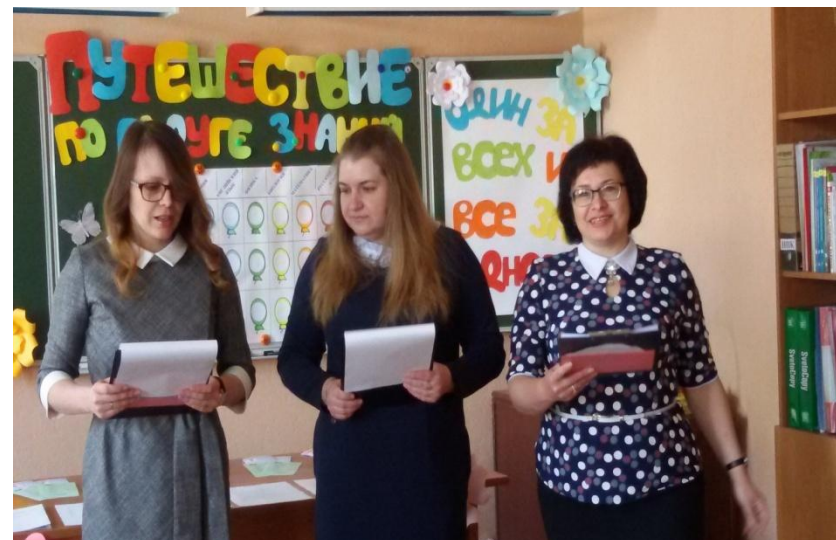
Профориентационная программа для школьников «Путешествие по радуге знаний»