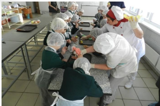
Мастер-класс для учащихся МБОУ «Гимназия № 12»