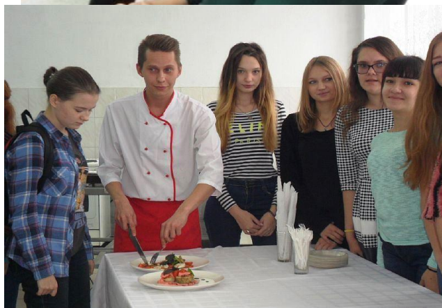
Мастер-класс для школьников