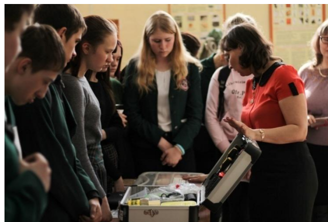
Экскурсии по техникуму для школьников