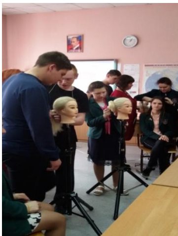
по профессии «Парикмахер»