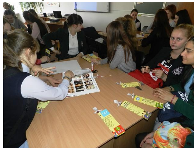
по специальности «Стилистика и искусство визажа»