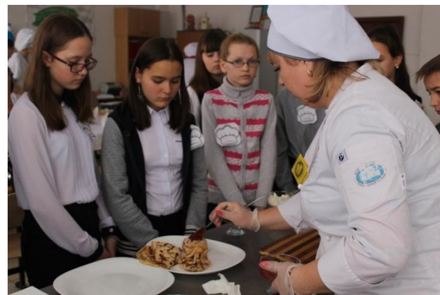
Мастер-класс для учащихся МБОУ «Школа № 20»